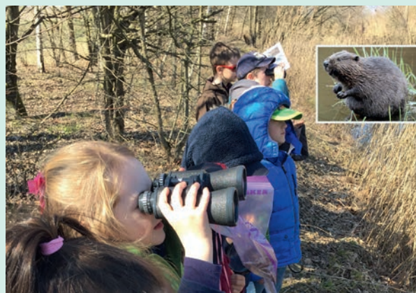
Démarche pédagogique en lien avec les castors